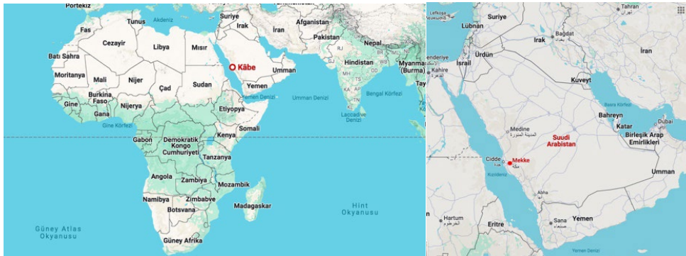
Şekil 1. Mekke'nin Konumu

İslam dini Arap Yarımadası'nda, Hicaz Bölgesi'nde, Kızıldeniz kıyısındaki Cidde kentinin 100 km kadar doğusunda yer alan bir vadiye kurulan Mekke'de ortaya çıkmıştır. Mekke yerleşimi doğusunda Safâ ve Merve tepelerinin olduğu Ebu Kubeys Dağı, batısında Kuaykiân Dağı, güneybatısında Sevr Dağı, kuzeydoğusunda Hira (Nur) Dağı ve Sebir Dağı, doğusunda ise Arafat Dağı ile çevrelenmektedir. Çöl karakterli arazi yapısına, sıcak ve kurak iklime sahiptir.