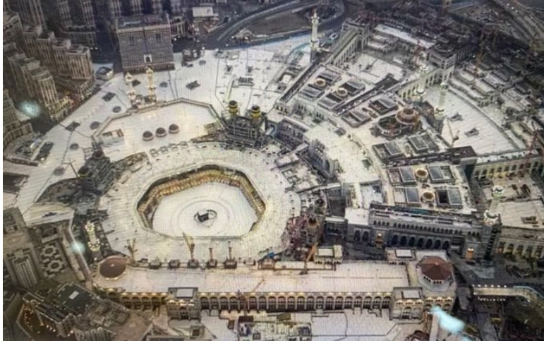
Şekil 2. Kâbe ve Mescid-i Harem

Günümüzde Mescid-i Harem, Kâbe ve revaklar arasındaki avlu görünümü açık kısım ile metaf adlı tavaf yapılan kapalı koridor kısmından oluşan geniş bir kutsal kompleks biçimindedir. Yapılan genişletmeler sonucundan 13 minare, Metâf adlı tavaf alanına girişi sağlayan dört kapı (Melik Abdülaziz Kapısı, Melik Fehd Kapısı, Fetih Kapısı, Umre Kapısı), Kâbe, yer altında yer alan ancak çeşmeler ile verilen Zemzem Kuyusu, Safâ ve Merve tepeleri arasında sa'y ibadetinin yapılmasını sağlayan Mes'a koridorundan oluşmaktadır. Hız. Muhammed döneminde yaklaşık 2.100 m 2 lik daire formunda bir meydan olan Kâbe günümüze kadar yapılan genişletmeler ile 320.00 m 2 ye ulaşmıştır (Alfelali ve Garcia-Fuentes, 2020, s.71). İbadet edecek kişi sayısını artırmak için kullanım alanının genişletilmesine yönelik mekânsal müdahaleler sonucunda Kâbe'nin çevresindeki birçok tarihi yapı yok olmuş, yoğun bir yapılaşma ortaya çıkmış, mekânın kutsal değer ve sembollerine zarar verebilecek kullanımlar artmıştır.